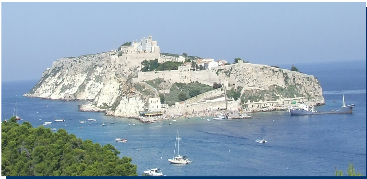
Appuntamento a San Nicola, sabato 11 luglio 2015, ore 21, piazza del "Montone"

Giorno di sole e di pioggia, di caldo e di vento improvviso, uno di quei momenti nei quali l'isola non ti nasconde il suo destino di essere piantata in mezzo al mare.